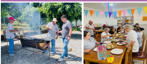
Dia de S. Pedro - Sardinhada