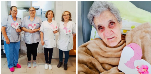
MAIO - Dia da Mãe