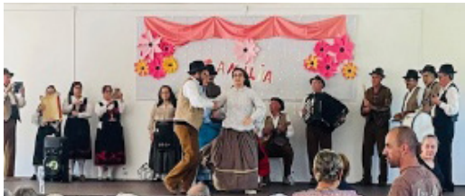
Festa da Família