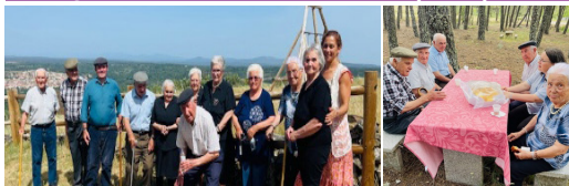
JUNHO - Dia Mundial do Piquenique