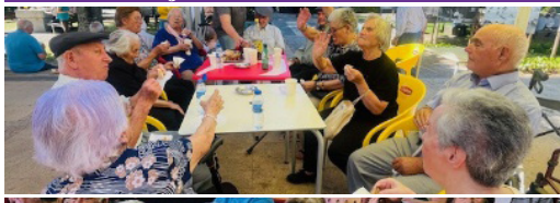
JULHO - Dia dos Avós