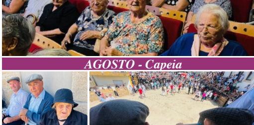
AGOSTO - Copeia