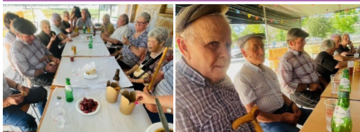
Lanche no Trutalcôa